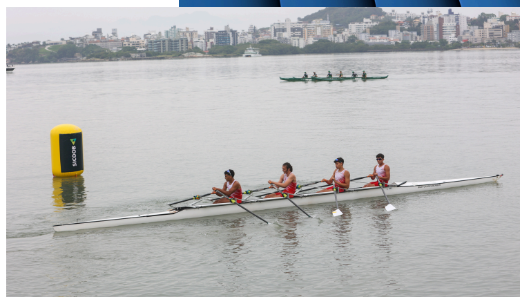
Four skiff (Quatro pessoas)