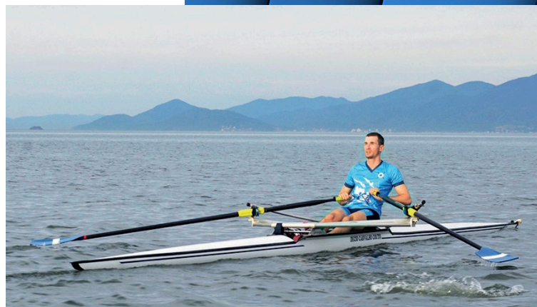
Single Skiff (individual)