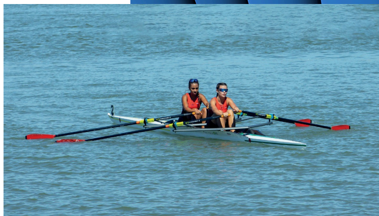
Double Skiff (duas pessoas)